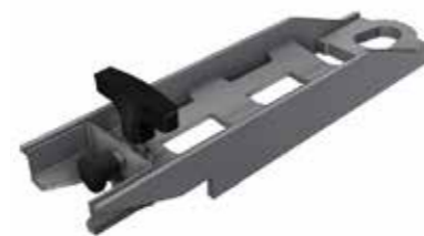
Extension du bras de levage